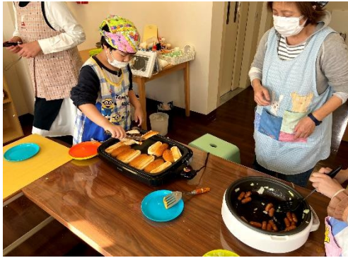
クッキングをしたり