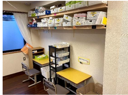
じぶんで課題に取り組んだり