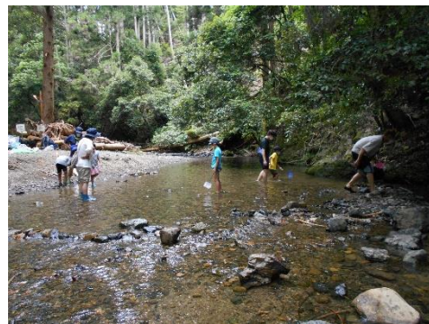
交通機関を使って外出したりします。